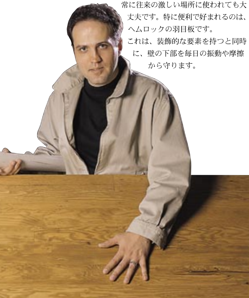
壁に最適なヘムロック