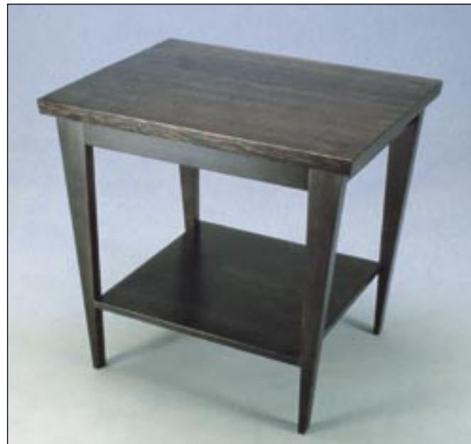
マイケル C. ピーターセンによるデザイン／制作、Garibaldi エンドテーブル

以下の写真にあるパシフィックコーストヘムロックの家具は、有名なKootenay School of the Artsで学ぶデザイナーの作品です。