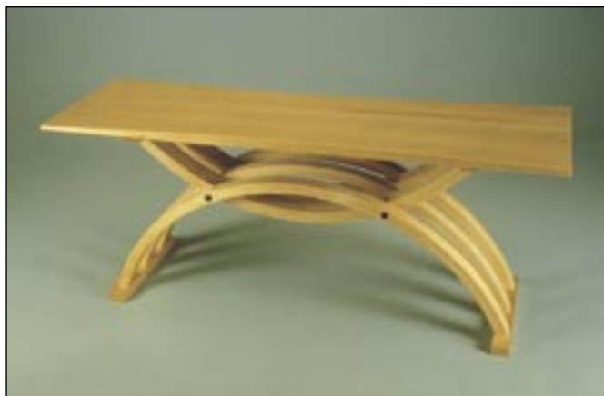
マーク ハマー作、Giacomoベンチ