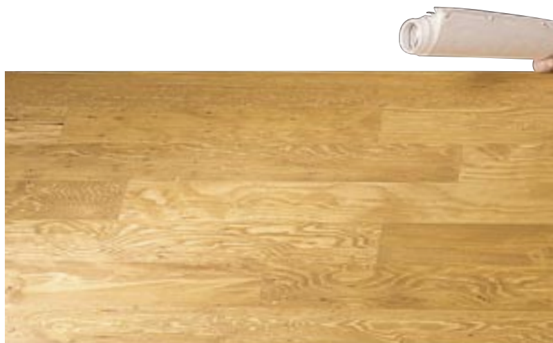
長さが自慢のヘムロックの床板