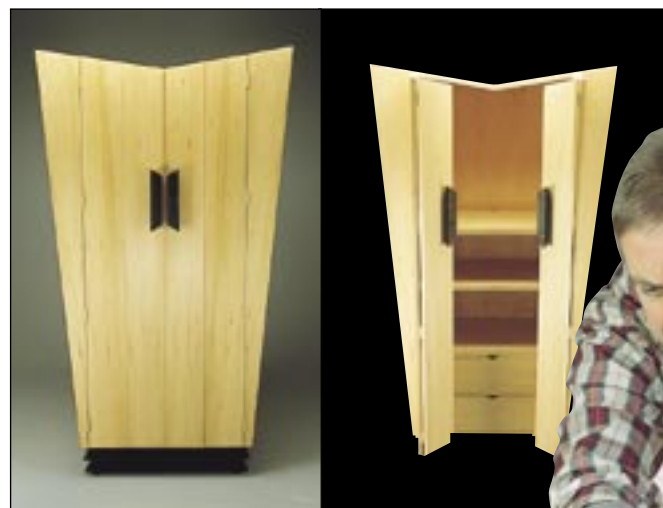
デビッド ストライクによるデザイン／制作、衣装タンス