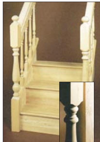
外観、強さ、長さ。一段ごとにパシフィックコーストヘムロックの良さを実感できます。

パシフィック コーストヘムロックはまた、大変長い板に加工できるため、16フィートの手摺にまで使用可能です。このように長く節のない板は、他の種類の木材では殆ど例がありません。