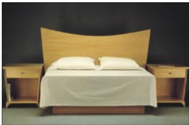
デビッド ストライク作、Garibaldi サイドテーブル&ヘッドボード

家具やインテリアデザインの傾向が明るい色になってきたことで、自然の薄茶色を持つ木目の細かい木材、パシフィックコーストヘムロックにスポットライトが当てられました。