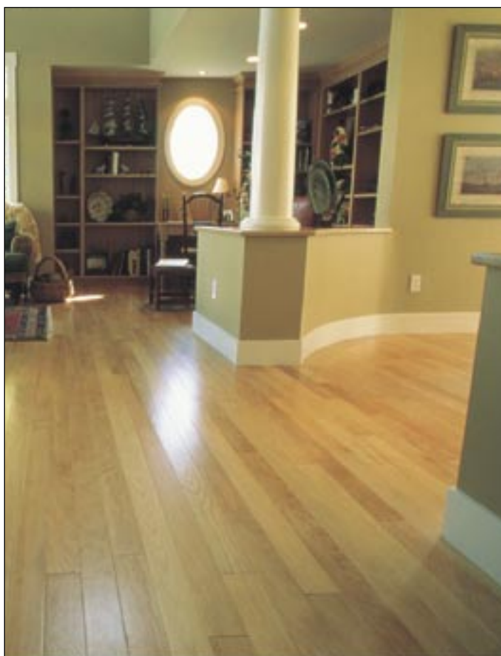
家中の床を美しく演出