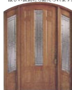
頑丈で狂いが無い、パシフィック コースト ヘムロックのドアは一生分の激しい振動にも耐えられます。

Nord Door社のデザイン／制作による、パシフィック コースト ヘムロック製のデラックスドア