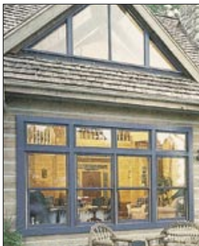
保護剤を塗りやすい素材

パシフィック コースト ヘムロックは、直線から微妙な曲線まで思いのままの形にデザインできます。