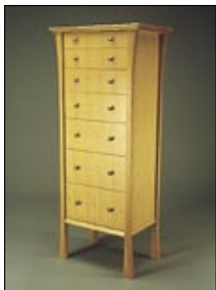
デビッドストライク作、ダイニングテーブルと7段引出しチェスト

相性の良さも、フィンガージョイントやエッジグルーで組み立てる家具のコンポーネントには最適です。