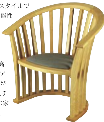
デビッド ストライク作、アトリウム チェア

ヘムロックの色および木目の均一性は信頼性が高く、生産ラインのすべての家具、またはインテリアの外観を統一したいデザイナーや生産者からは、特に重宝がられています。木目の模様や色、テクスチャーを極端に変えることなく、マッチするすべての家具を視覚的に均一に仕上げるのが可能なのです。