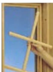
取りはずし可能な窓格子は手入れが簡単