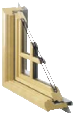
窓伝統的な窓と固定型の格子